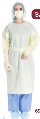
BATA DE AISLAMIENTO