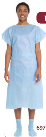
BATA DE PACIENTE